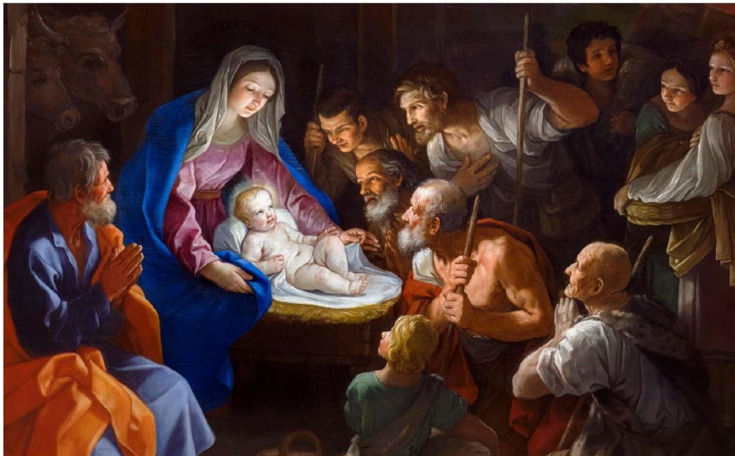
Bildausschnitt Geburt Christi Gemälde "die Anbetung der Hirten" von Guido Reni

Römisch-katholische Kirchgemeinde Roggenburg | Ederswiler